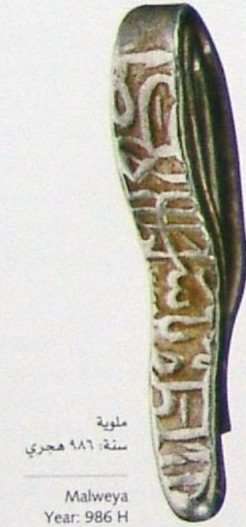
ملوية سنة: ٩٨٦ هجري